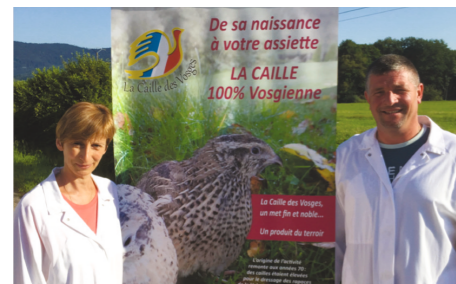
Ein Familienbetrieb mit 50 Jahren Erfahrung

9 Wochen alt sind und ein Lebendgewicht von 350 bis 450 Gramm erreichen. Wenn die Tiere ihr optimales Gewicht erreicht haben, werden sie vor Ort geschlachtet.